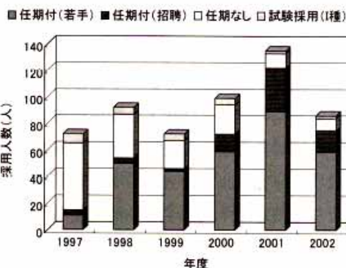
図2 産業技術総合研究所の研究職員採用数の推移

2001年4月、旧通商産業省・工業技術院傘下の15研究所が統合されて、独立行政産業技術総合研究所(以